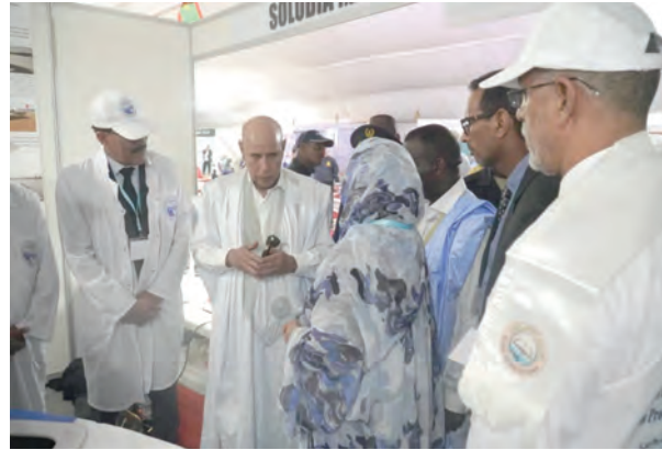
Lancement des activités de l'Agence de Développement de la Pêche et de la Pisciculture Continentales à Kaédi