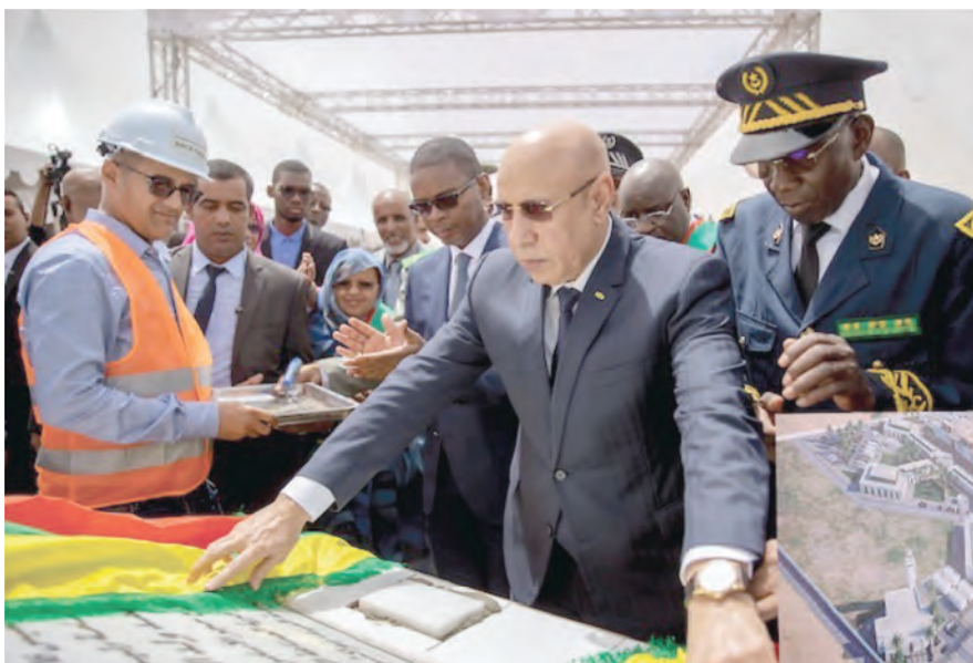
Pose de la première pierre d'un village de l'artisanat à Nouakchott (les travaux ont connu des avancées importantes au cours de la période août 2022-juillet 2023)