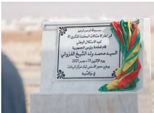
Pose de la première pierre du projet de construction d'un Datacenter à Nouakchott (les travaux ont connu des avancées importantes au cours de la période août 2022-juillet 2023)