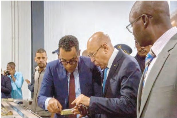
Usine de fabrication de conserves de poisson avec une capacité de production de 100000 boîtes par jour