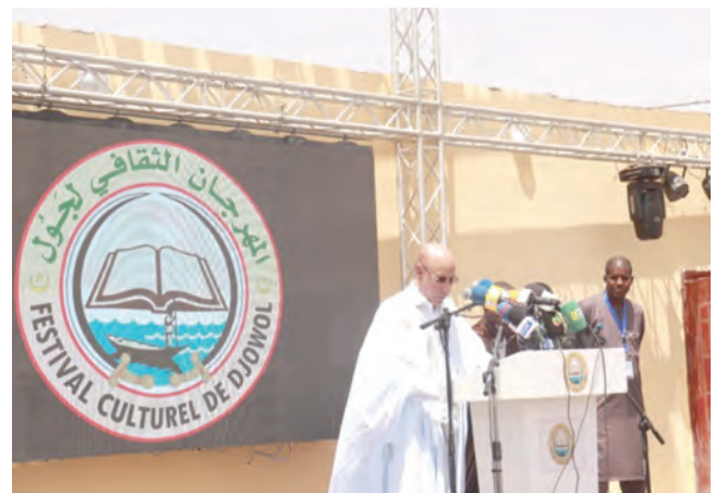
Première édition du Festival Culturel de Djowol