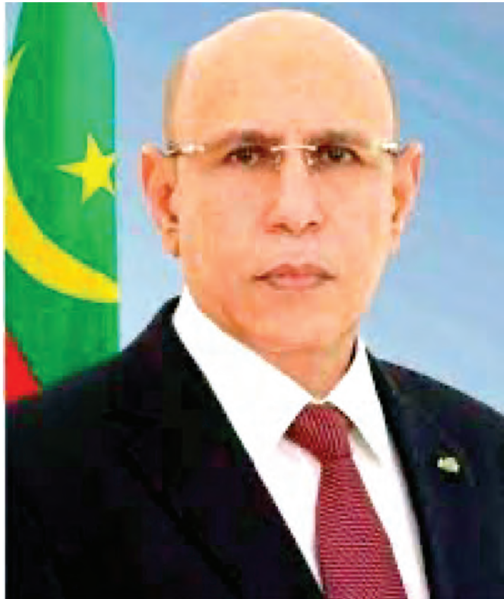
SEM Mohamed Ould Cheikh El-Ghazouani Président de la République Islamique de Mauritanie