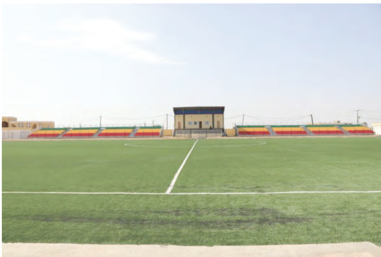
Stade Ramdhane à Rosso