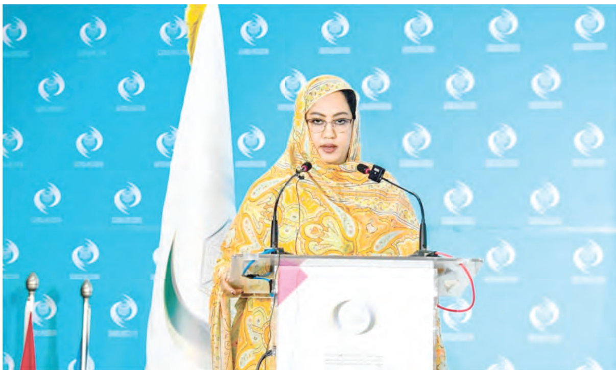
Conférence mondiale sur la femme et la gestion des universités, organisée à Rabat par l'ISESCO (Organisation Mondiale Islamique pour l'Education, la Science et la Culture) .