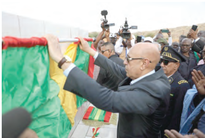
Le Président de la République inaugure la deuxième phase du premier volet du projet Aftout Echergui