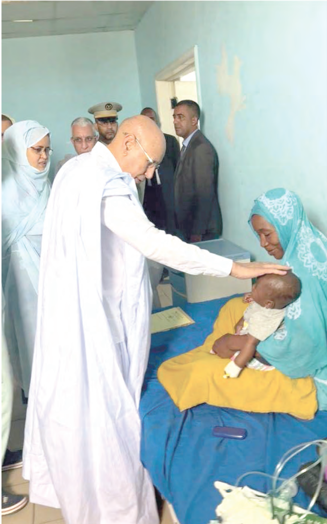
Visite de certaines structures de santé