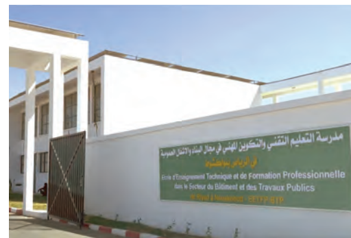
Inauguration de l'École d'Enseignement Technique et de Formation professionnelle des Bâtiments et Travaux publics de Riadh, wilaya de Nouakchott-Sud