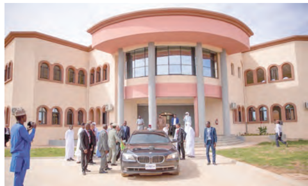
Chancellerie et Ambassade de Mauritanie à Niamey (Niger)