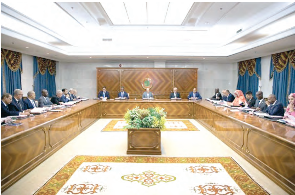
Conseil des ministres en date du 21 août 2023

Ainsi, ce rapport annuel, présenté et approuvé lors du Conseil des Ministres en date du 21 août 2023 (Extrait de décision n° 139), est décliné par axes stratégiques du Programme TAAHOUDATY.