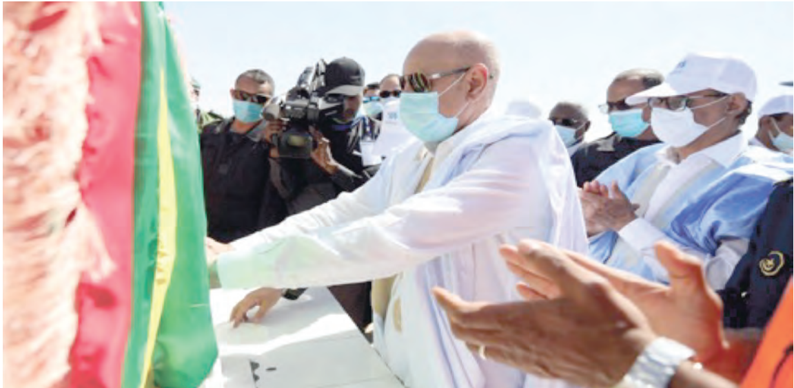
Lancement du projet d'électrification rurale de la Zone d'Aftout El Echargui desservant 34 localités (lot 1 : construction d'une ligne de 90 kV lot2 : réseau et branchement)