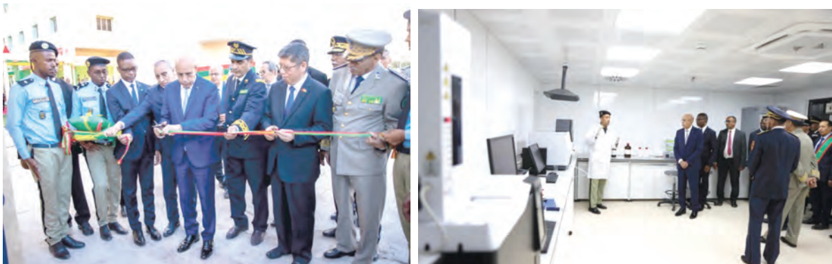
Inauguration du dispositif de sécurité et de contrôle de Nouakchott- ville (les travaux ont connu des avancées importantes au cours de la période août 2022-juillet 2023)