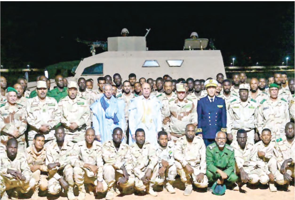
Iftar (coupure du jeûne du Ramadan) avec un groupe de soldats stationnés à Nbeiket Laouach (wilaya du Hodh Echargui)