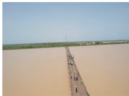
Lancement des travaux de construction du pont de Rosso entre le Sénégal et la Mauritanie

Par ailleurs, dans le cadre de la modernisation de notre capitale et de l’amélioration de la mobilité urbaine, les réalisations suivantes ont été enregistrées :