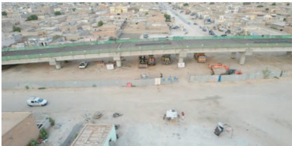
Echangeur Bamako à Nouakchott

(les travaux ont connu des avancées importantes au cours de la période août 2022-juillet 2023)