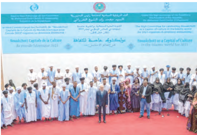
Le lancement des activités de Nouakchott, Capitale de la Culture dans le Monde Islamique pour l'année 2023 ;