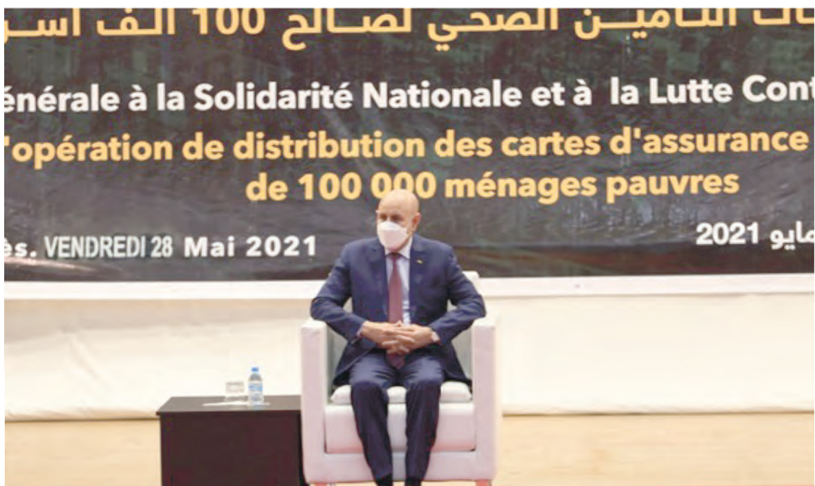
Cérémonie du lancement officiel d'une assurance maladie complète et gratuite pour les 100.000 ménages les plus pauvres (les travaux ont connu des avancées importantes au cours de la période août 2022-jUILLET 2023)