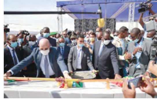
إطلاق أشغال إنشاء جسر روصو بين السنغال وموريتانيا (حققت الأشغال تقدماً ملحوظاً خلال الفترة بين أغسطس 2022 - يوليو 2023)