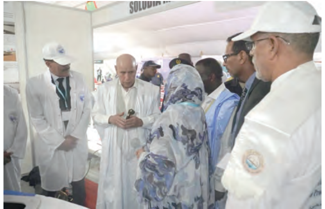
مصنع لمعلبات الأسماك بطاقة إنتاجية 100 ألف علبه يوميا