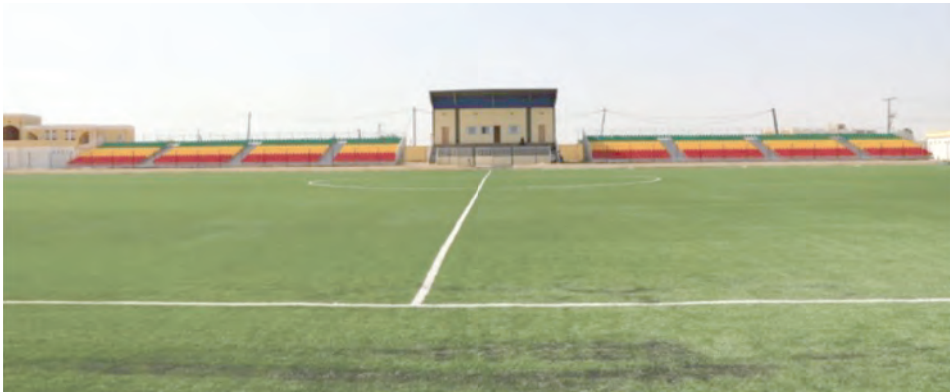
ملعب رمضان بروضو