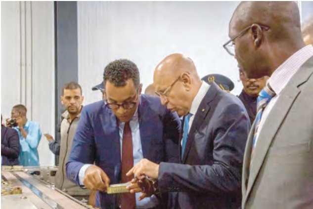
إطلاق أنشطة الوكالة القارية لتنمية مصايد الأسماك وتربية الأسماك في كيهيدي