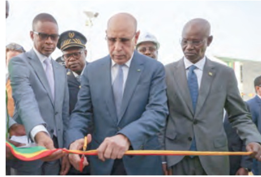
تشدين مدرسة التعليم الفني والتكوين المهني للمباني والأشغال العامة بالرياض ولاية نواكشوط الجنوبية