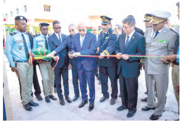
تدشين منظومة الأمن والمراقبة لمدينة نواكشوط

(حققت الأشغال تقدماً ملحوظاً خلال الفترة بين أغسطس 2022 - يوليو 2023)