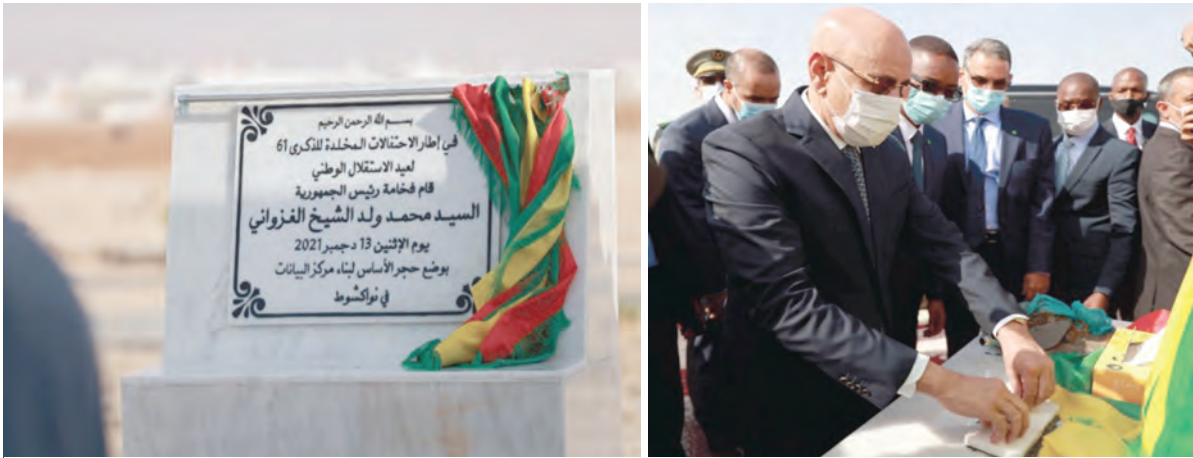
وضع الحجر الأساس لمشروع إنشاء مركز البيانات بانواكشوط (حققت الأشغال تقدماً ملحوظاً خلال الفترة بين أغسطس 2022 - يوليو 2023)

وبالإضافة إلى ذلك ، هناك إصلاحات مهمة أخرى قيد الإنجاز :