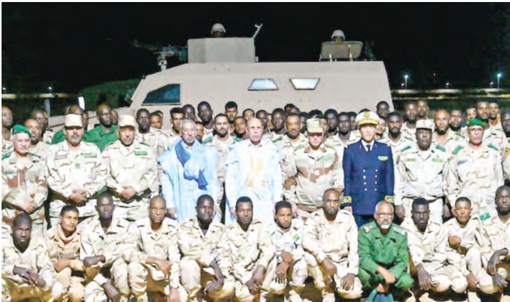
إفطار مع مجموعة من الجنود مرابطة بمقاطعة اظهر ولاية الحوض الشرقي خلال شهر رمضان المبارك