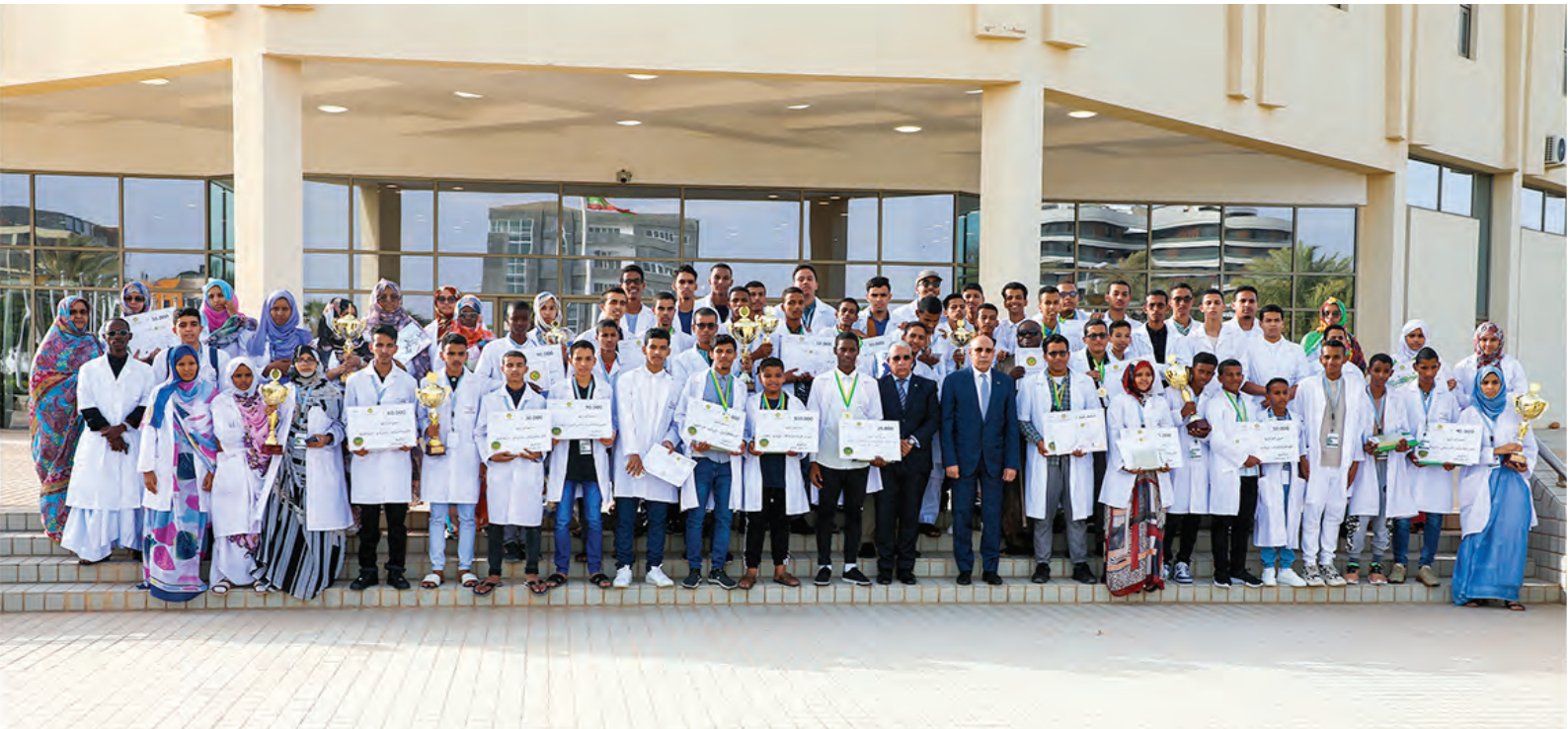
حفلة تسليم جائزة رئيس الجمهورية للعلوم، للتلاميذ والطلاب المتفوقين في المسابقة الوطنية الأولمبياد ورالي العلوم