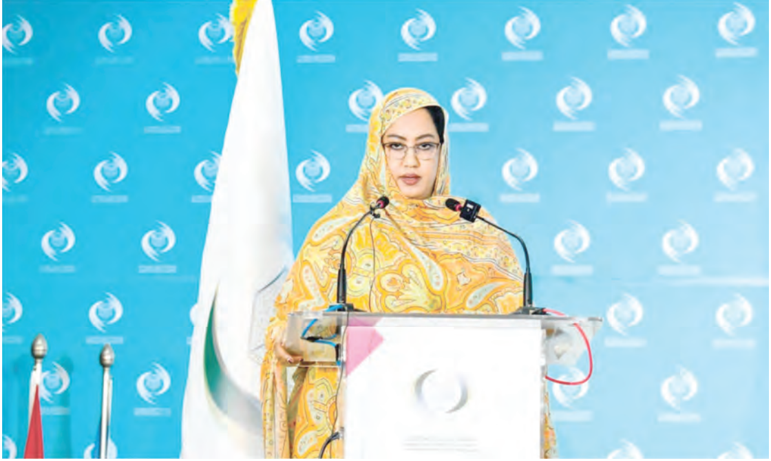
المؤتمر الدول حول المرأة وقيادة الجامعات الذي نظمته بالرباط منظمة العالم الإسلامي للتربية والثقافة والعلوم (إيسيسكو).