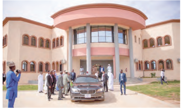
تدشين مقر السفارة الموريتانية في انيامي (النيجر)