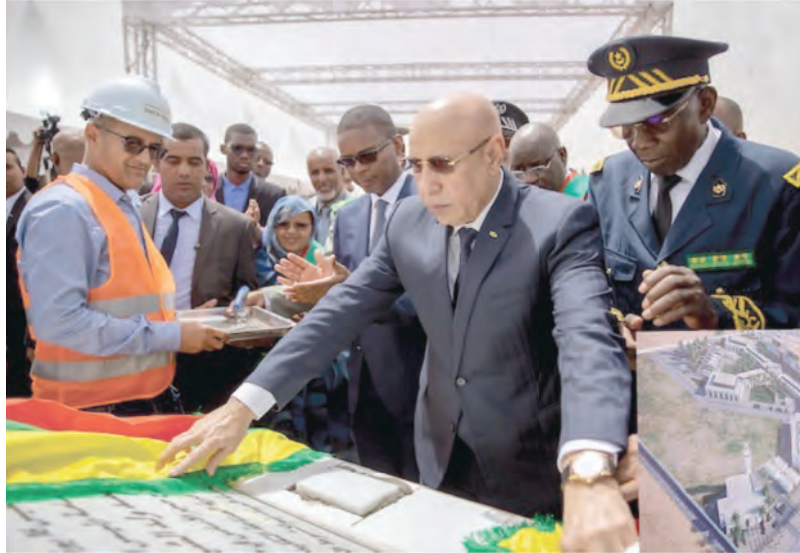
وضع الحجر الأساس لقرية الصناعة التقليدية بنواكشوط (حققت الأشغال تقدماً ملحوظاً خلال الفترة بين أغسطس 2022 - يوليو 2023)