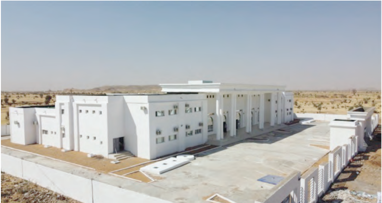
مقر المجلس الجهوي في سيلبابي