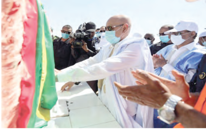
إطلاق مشروع الكهرباء الريفية بمنطقة أفطوط الشرقي لصالح 34 بلدة (المرحلة 1: إنشاء خط 90 ك.ف. المرحلة 2: الشبكة والربط)