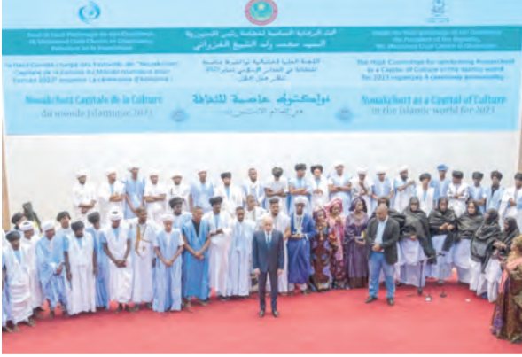
إطلاق فعاليات نواكشوط عاصمة الثقافة في العالم الإسلامي لسنة 2023