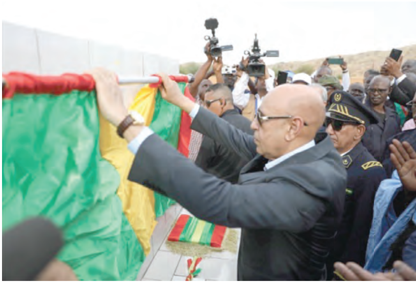
رئيس الجمهورية يبدن المرحلة الثانية من الجزء الأول من مشروع أفطوط الشرقي