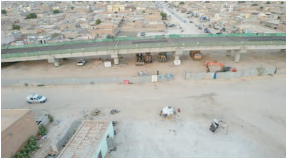
محول باماكو بانواكشوط (حققت الأشغال تقدماً ملحوظاً خلال الفترة بين أغسطس 2022 - يوليو 2023)