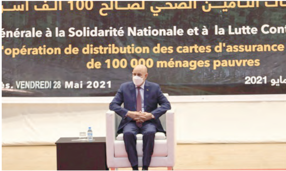
حفل الإطلاق الرسمي للتأمين الصحي الشامل والمجاني لصالح 100 ألف أسرة متعفة (حققت الأشغال تقدماً ملحوظاً خلال الفترة بين أغسطس 2022 - يوليو 2023)