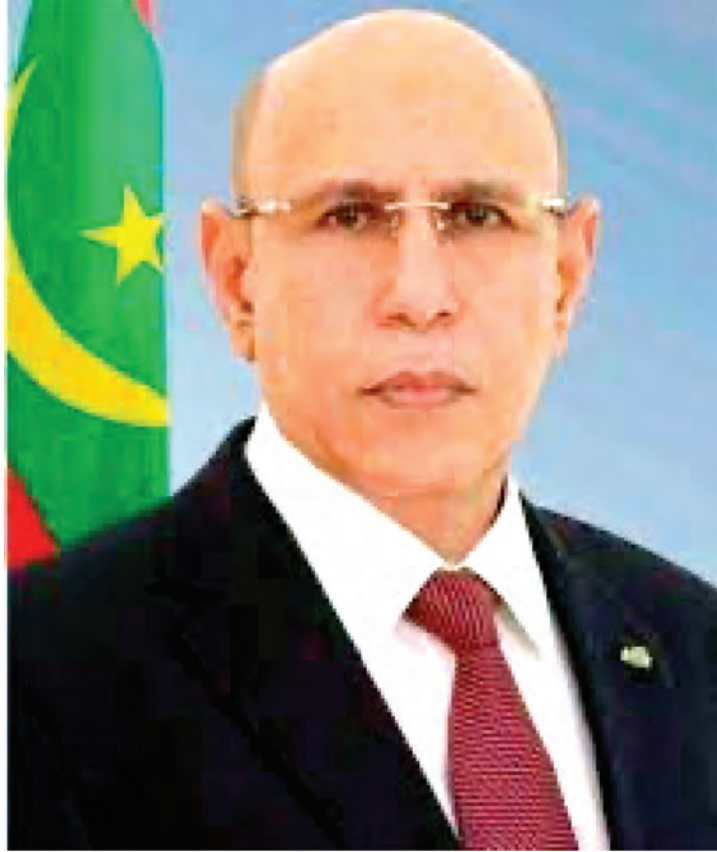
رئيس الجمهورية الإسلامية الموريتانية محمد ولد الشيخ الغزواني