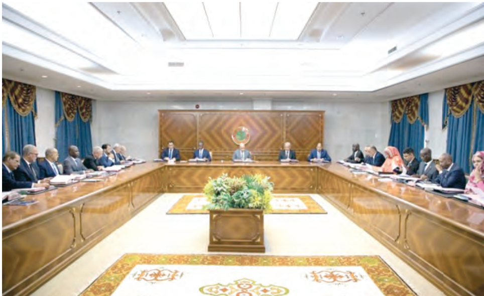
مجلس الوزراء بتاريخ 21 أغسطس 2023

إن هذا التقرير السنوي، المقدم والمصادق عليه في مجلس الوزراء بتاريخ 21 أغسطس 2023، (مستخرج من القرار رقم 139) مقسم حسب المحاور الاستراتيجية لبرنامج تعهداتي.