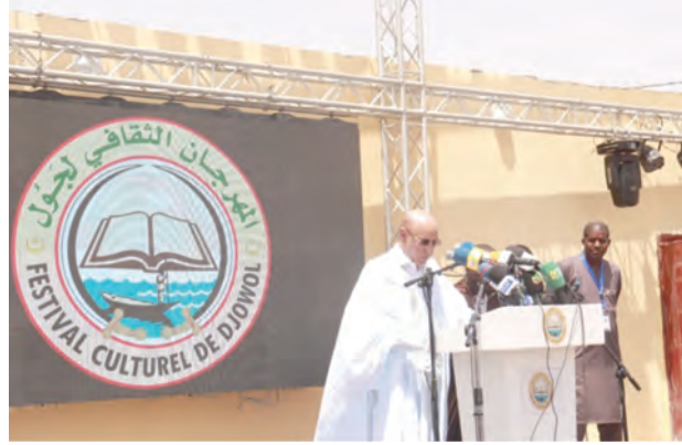
الدورة الأولى لمهرجان جول الثقافي